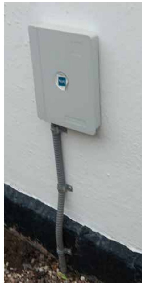
Flere husstande kan nu se frem til at få den her lille box sat op ved deres ejendom.

Med den nye udvikling på fibernetfronten i Kildebrønne åbner der sig