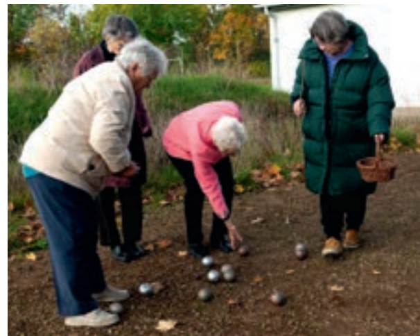
Hmm, ligger din kugle mon tættere end min?