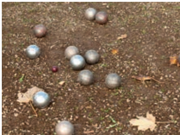
Hver spiller har sine egne kugler

- Vi betaler ikke kontingent, og man møder bare op, hvis man har lyst til at spille. Vi plejer at være en 7-8 stykker i alt, men der er absolut plads til flere, så kom bare frisk, hvis du har mod på at prøve det. Når der er runde fødselsdage og lignende, samler vi lidt penge ind for at fejre det, og så mødes vi fast til en julefrokost hvert år.