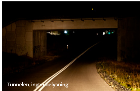
Tunnelen, ingen belysning